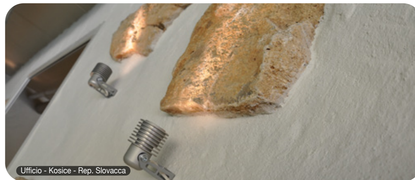
Ufficio - Kosice - Rep. Slovacca